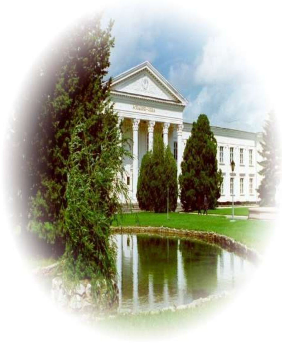
Інститут тваринництва степових районів імені М.Ф. Іванова "Асканія-Нова" – Національний науковий селекційно-генетичний центр з вівчарства