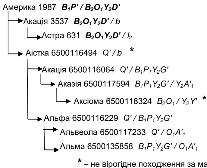
Рис. 1. Схема успадкування алелів EAB-локусу у родині Америки 1987

Розглянемо випадки помилок походження за матір'ю на прикладі схеми успадкування алелів EAB-локусу у родині Америки 1987 (рис. 1).