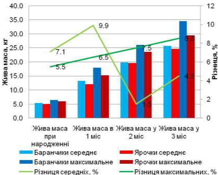
Рис. 1. Динаміка живої маси молодняку

Середньодобові прирости ягнят були нерівномірними в різні вікові періоди та залежали від їх статі (табл. 2).